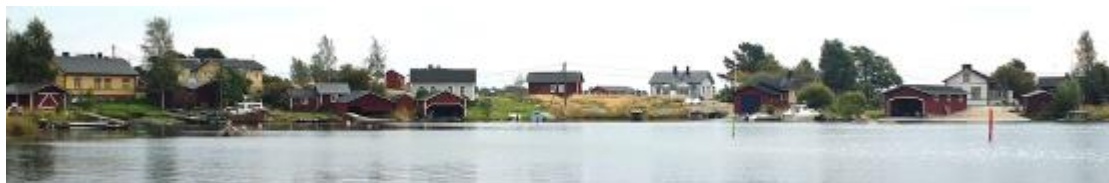
Kotka, Haapasaari, väldikodálávt tivrás enâdâhkuávlui.

Pirâsministeriö lii valmâštâlmin väldikodálávt tivrás enâdâhkuávlui luvâttállâm peividem. Kuullâmkiärdü ääigi enâdâhkuávluin adeluvvojii paijeel 400 ciälkkámuššâd já arvâlussâd, mooid kyeskee oohânkiasu lii tääl vaalmâš. Ciälkkámušâi já arvâlusâi adeleijeh iävtuttii ohtsis 27 kuávlud maid lasettiđ luvâttálmân.