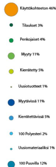
Poistotekstiilikoonti 2018 Lounais-Suomen Jätehuolto Kokonaiskeräysmäärästä poistotekstiiliä 101 000 kg