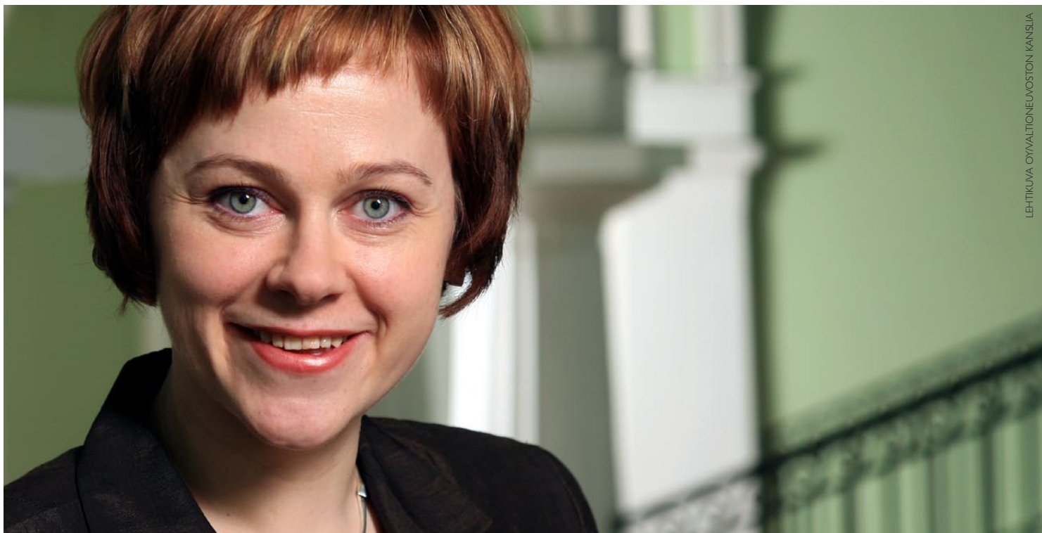
Paula Lehtomäki, varapuheenjohtaja, ympäristöministeri